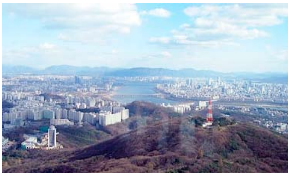
Photo de la vue prise dans l'observatoire de la Tour de Séoul