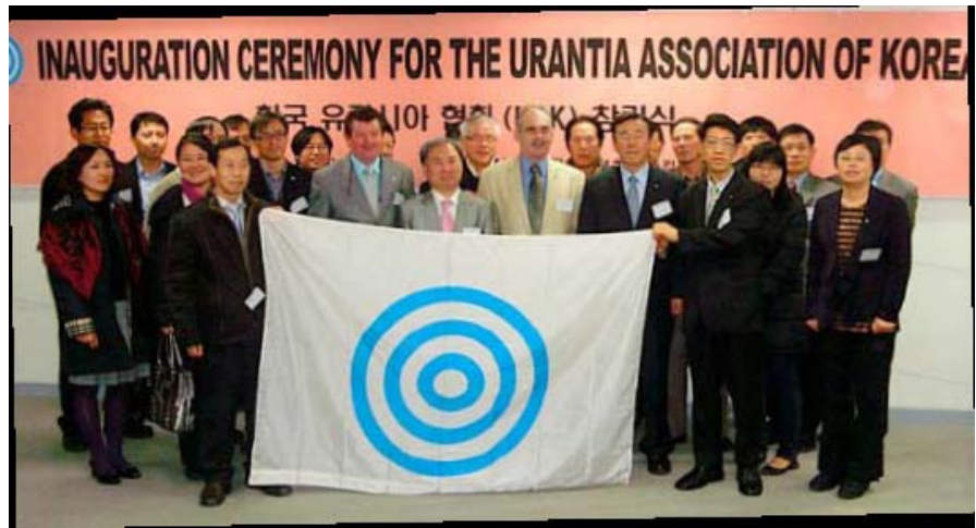
La photo de groupe de la nouvelle Association Urantia de Corée