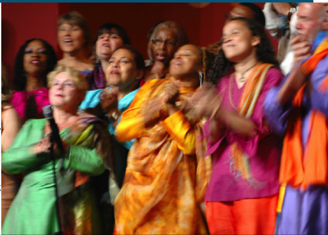
Photo. La chorale Agape au Parlement des religions du Monde, Melbourne Australie