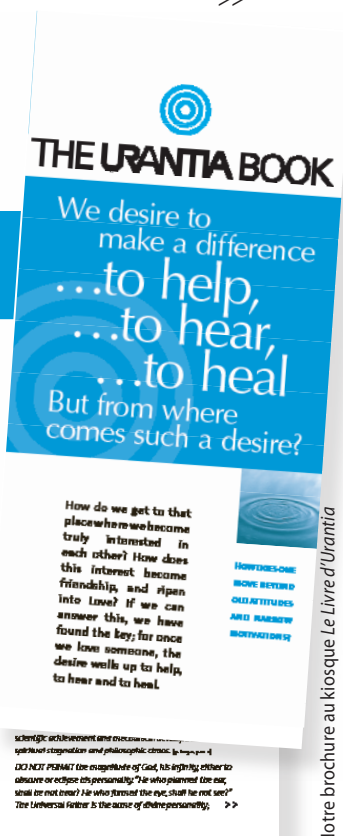
Notre brochure au kiosque Le Livre d’Urantia

The authors of The Urantia Book do not describe or advocate a new organized religion. They build on the religious heritage of the past and present, encouraging a personal, living religion based on faith and on service to one's beliefs. This spiritual awakening would launch a new and improved era of human relationships, so that we can realize social brotherhood on our planet and achieve lasting peace and good will through the spiritual transformation of each individual and all mankind.