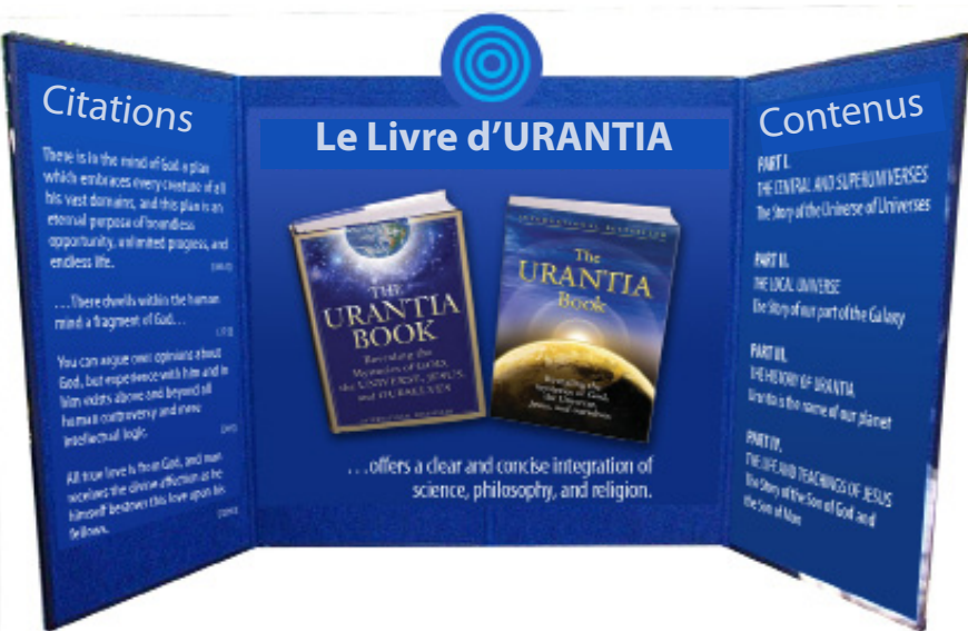
Notre brochure au kiosque du Livre d’Urantia

Le thème du Parlement des religions du Monde 2009 était le suivant :