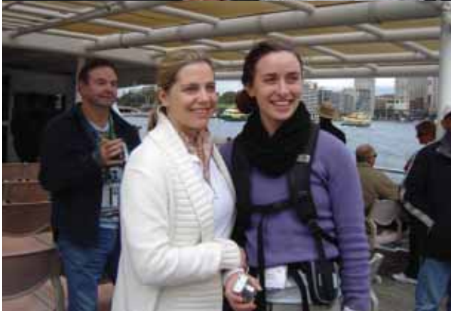
Conférence Internationale – Sydney, Australie