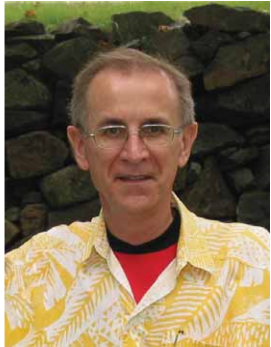
La peinture de la page couverture de ce mois, a été peint par Maurice Migneault en 1976

MAURICE MIGNEAULT L'Association Urantia du Québec