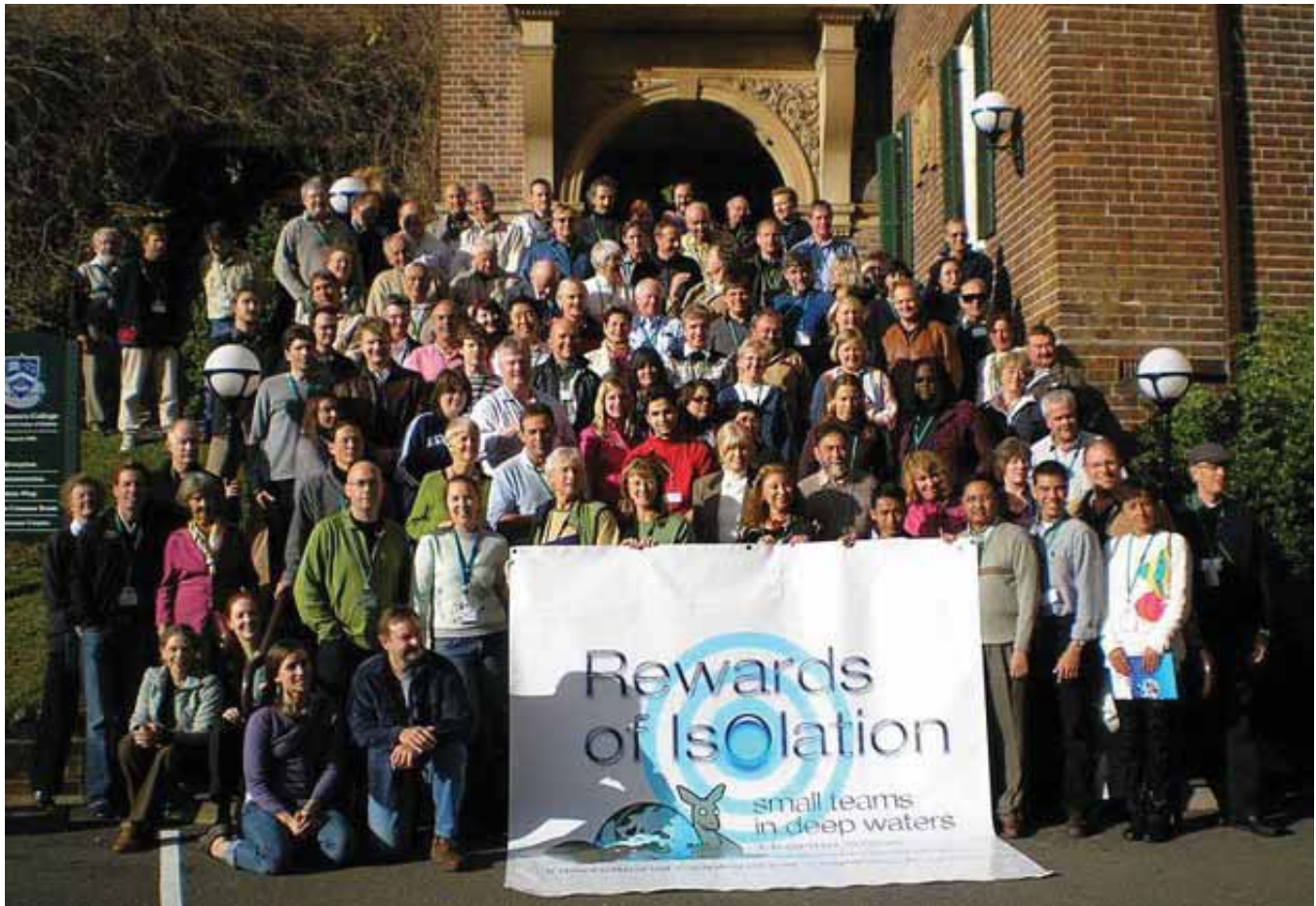
Rassemblement pour une photo de groupe