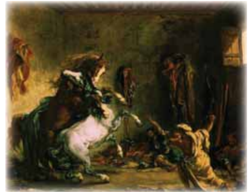
"Les chevaux arabes se battant dans l'écurie" Eugène Delacroix, 1860

Qu'il est difficile de garder le silence intérieur Sans subir l'assaut constant de ces de pensées inutiles. Apprenons à dompter ces ombres folles Qui peuplent les parois de notre âme. Nous ne pouvons progresser tant que nous ruminons Des pensées parasites de peur, d'angoisse et de haine. Ne les laissons pas gagner sur nous ! Coupons-leur les vivres ! Sortons-les de l'obscurité dont ils se nourrissent Et aveuglons-les de la lumière de notre coeur. Il n'y a rien de plus sain pour l'esprit Qu'un petit brin de folie En autant qu'il demeure sous notre contrôle. Lorsqu'il va et vient à sa guise, C'est le désordre, C'est le danger qui guette et rôde. La solitude tout comme la peur Est un grand cri de désespoir Qui ne résonne qu'à l'intérieur Et que personne d'autre n'entend. Cessons d'être des acteurs de la liberté Se cachant à soi-même et aux autres Les ombres de nos barreaux fictifs. La recherche de la perfection est un but Si elle reste devant nous Mais une prison si elle nous entoure. C'est nous qui sommes les maîtres. Gardons notre esprit sain. Nettoyons-le sans cesse De ces idées fixes qui s'y déposent. Les tentations n'ont d'emprise sur nous Que si nous demeurons à leur hauteur. Restons toujours alertes Dans la promotion de la simplicité. C'est là notre labeur quotidien Et l'assurance de notre félicité.