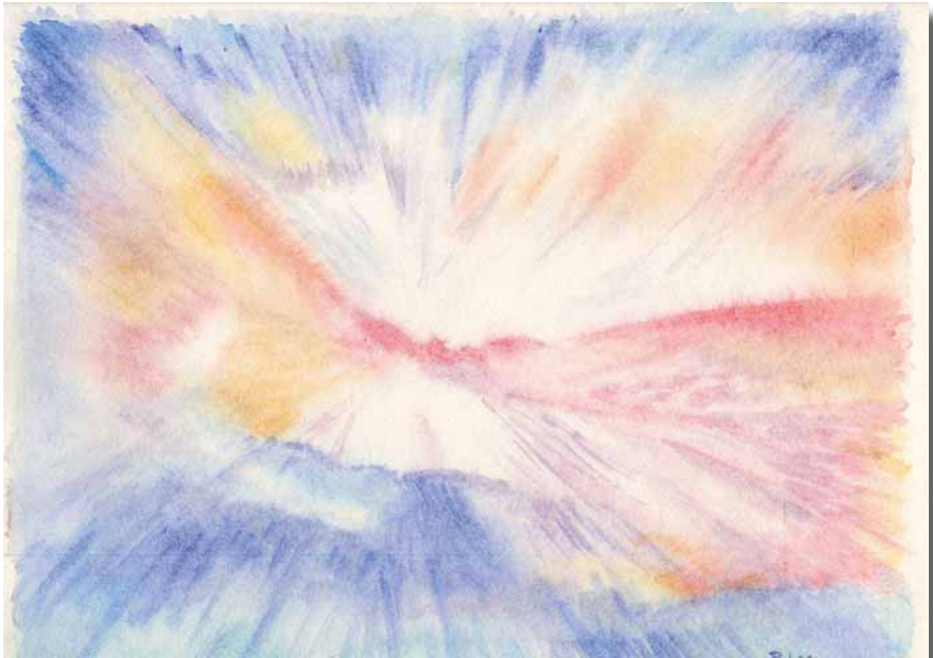
"L'Ange", aquarelle de Philippe Anselin de Maureillas, France