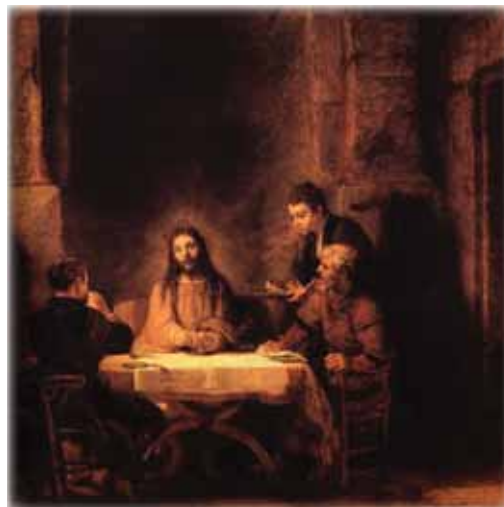
"Souper à Emmaüs" Rembrandt van Rijn, 1629

Un fragment du Père habite en nous. Notre guide peut seulement nous montrer le droit chemin Mais toujours, Nous devons choisir.