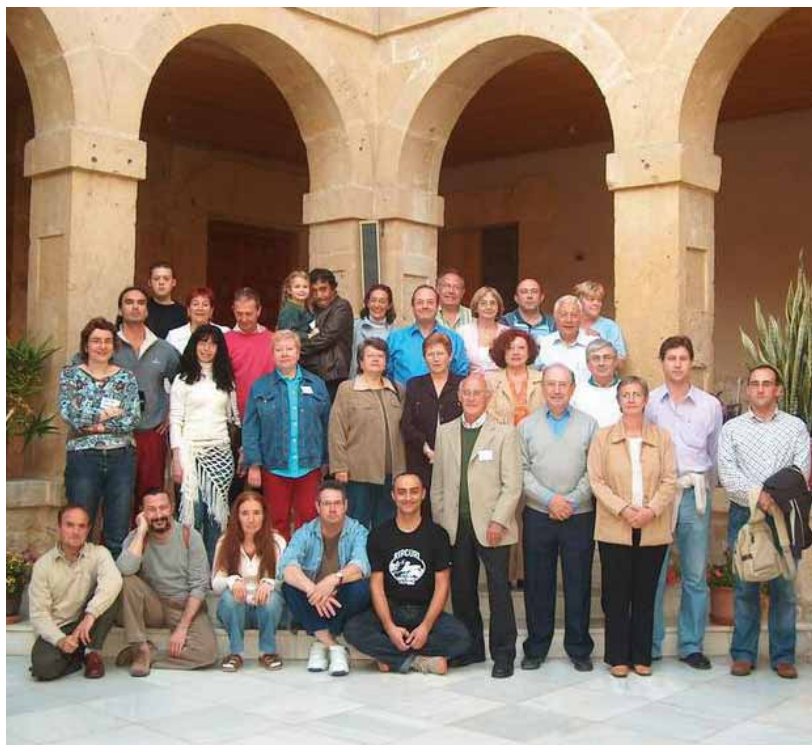
Photo de groupe

Burgos et Majorque, parmi tant d'autres endroits. Même un couple d'amis habitant en France près de la frontière espagnole est venu pour être avec nous lors de cet événement. Nous avons offerts du matériel aux participants, comme un CD avec des travaux secondaires, des lettres de nouvelles, etc., tous accessibles