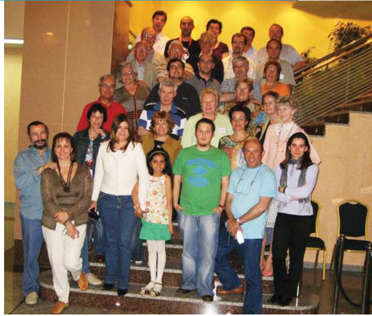
Foto de grupo. Más fotos en http://www.urantia-uai.org/photos/index.html

El Encuentro concluyó oficialmente con la reunión de clausura, donde dimos la palabra a