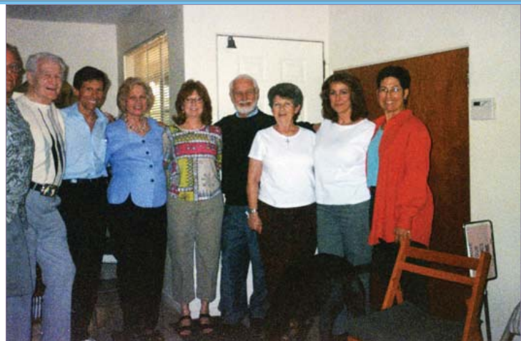
Foto de grupo de Arizona