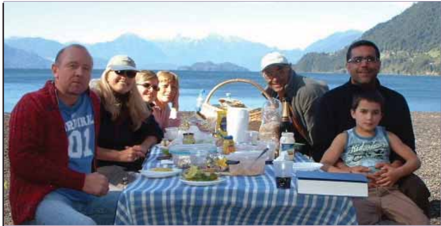
Picnic en el Lago Todos Los Santos