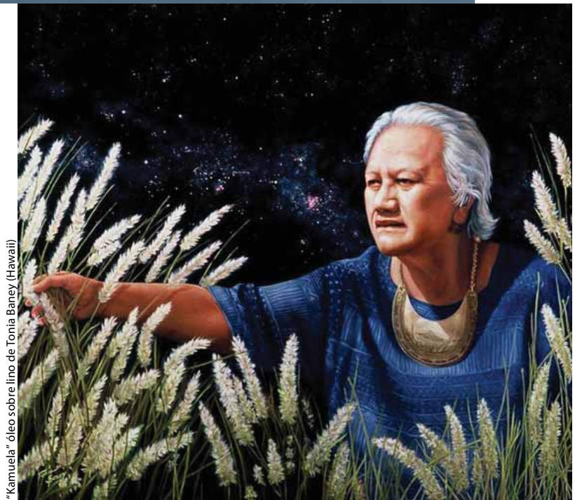
"Kamuela" óleo sobre lino de Tonia Baney (Hawaii)