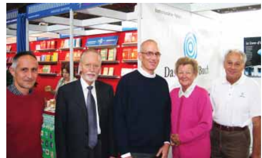
Presentación del Libro de Urantia en la mayor feria de libros de la zona de habla alemana.