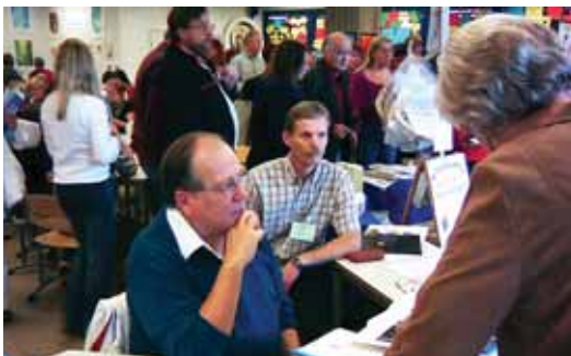
Dos ferias: arriba, la feria "Yo Soy" y abajo, la feria "Espíritu y Conocimiento"

RAIMO ALA-HYNNILÄ gadonia@kolumbus.fi Suomen Urantia-seura ry.