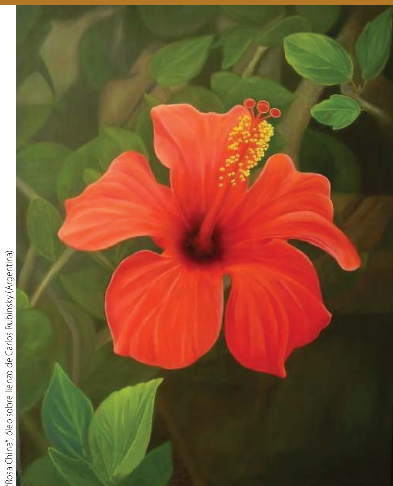
"Rosa China", óleo sobre lienzo de Carlos Rubinsky (Argentina)

Asociación Urantia Internacional ■ http://urantia-uai.org ■ EDICIÓN ESPAÑOLA ■ Nº 19 ■ Diciembre de 2006