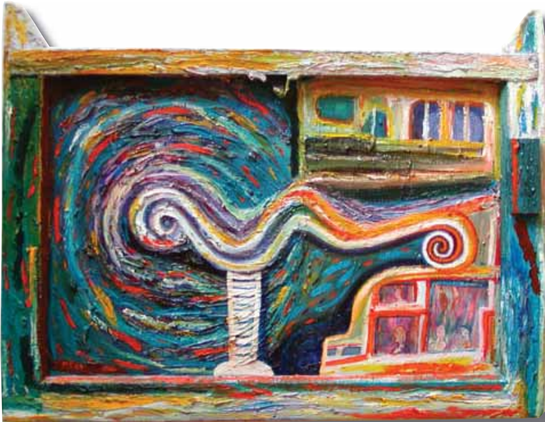
"Pasajeros", óleo sobre ventana, pintura de M. Caoile