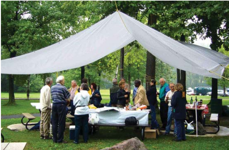
Picnic en Montréal