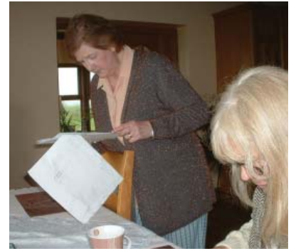
La guardiana del Megalito