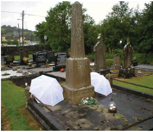
Lápida de familia Graham

final de nuestro viaje de dos semanas por la Isla Esmeralda.