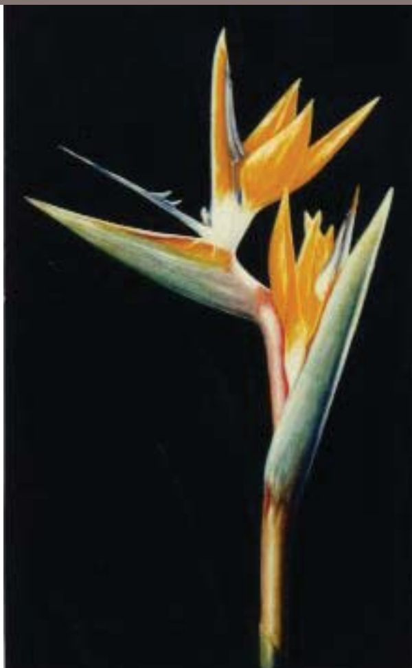
«Pájaros del Paraíso» óleo sobre tela de Carlos Rubinsky (Buenos Aires, Argentina)