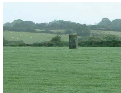
Megalito de Muff