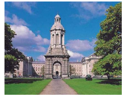
Trinity College, Dublin

Las escaleras de escalones interiores se replegaban hacia arriba de modo que el enemigo no pudiera alcanzar la cima. Si alguna vez van a Irlanda, deben visitar este lugar, es un sitio asombroso. Me sentí feliz de que el Trinity College tuviera finalmente un Libro de Urantia , y recé para que algún día todas las bibliotecas universitarias de este planeta tuvieran pronto un LU en sus estanterías.