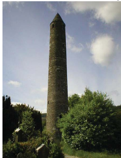
Torre de Glendalough

los hacen así), fue donado al Trinity College de Dublín. Trinity tiene una de las bibliotecas universitarias más importantes del mundo. Allí se guarda El Libro de Kells, uno de los primeros libros cristianos que sobrevivieron a los estragos del tiempo. Para más información, visiten la página http://www.snake.net/people/paul/kells/thumbnails . Mientras contemplaba El Libro de Kells me preguntaba si, dentro de 1200 años, la gente se pondría en cola del mismo modo para ver una de las primeras revelaciones del Libro de Urantia . El Libro de Kells contiene bellos manuscritos hechos en pergamino de piel de cordero y escritos por monjes que vivieron en las condiciones más austeras y que protegieron estos manuscritos de los vikingos en torres como ésta de Glendalough.