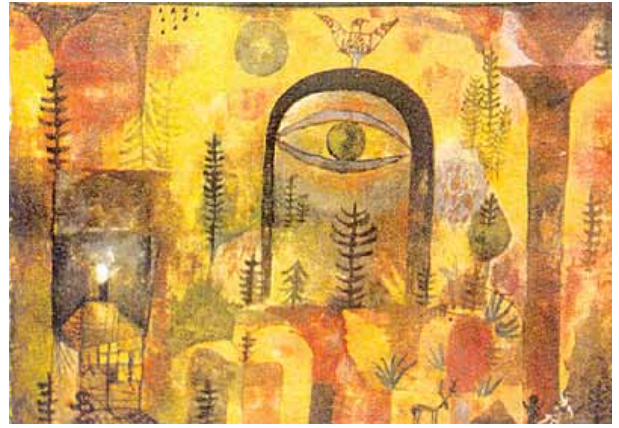
"Con el Águila" Paul Klee, 1918