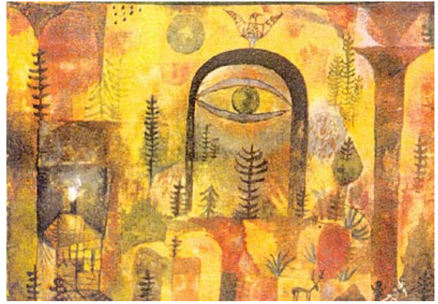
"Con el Águila" Paul Klee, 1918