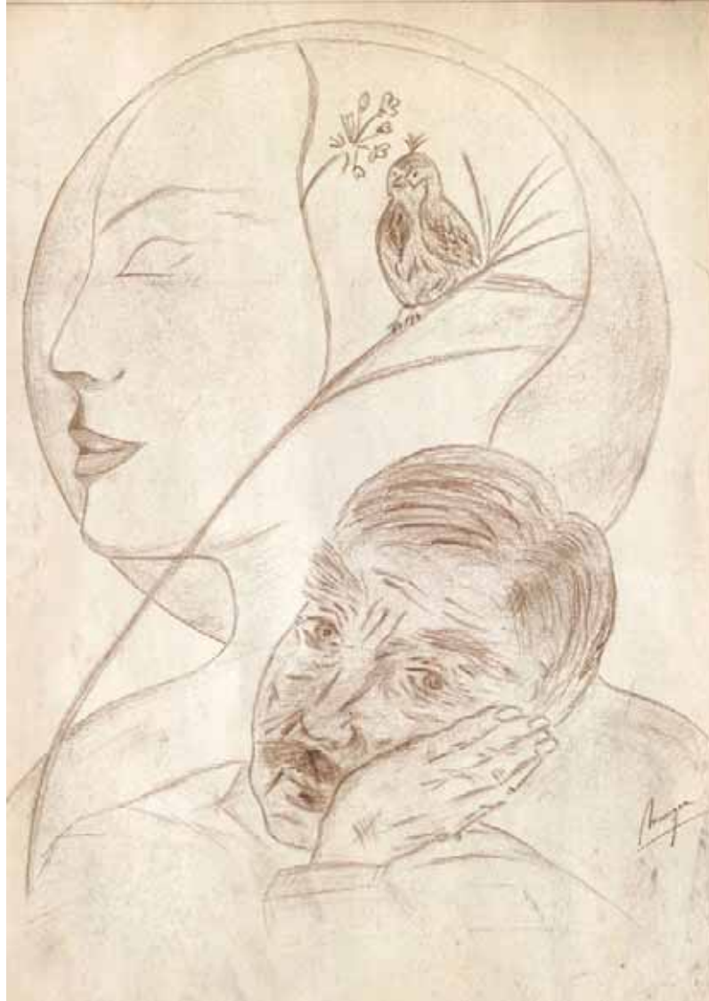
"La melodía del alma", dibujo de Monique Fennes (España)