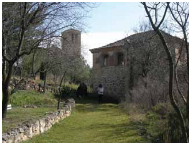
Monasterio de san Juan de la Cruz en Segovia, cerca de Madrid