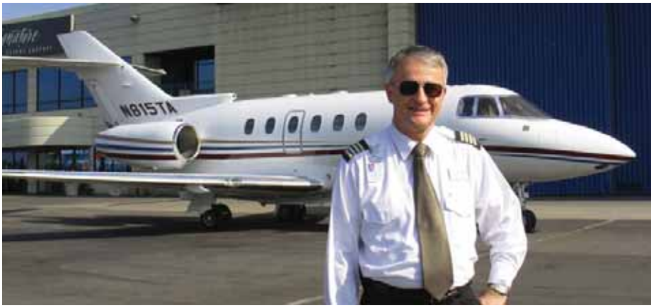
Mark con un reactor Hawk