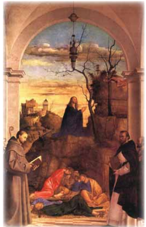
"Cristo rezando en el Jardín" Marco Basaiti, óleo en tabla, 1516

A mi amado Padre-Madre y a mi familia Sin los que yo sería sencilla y verdaderamente, nada