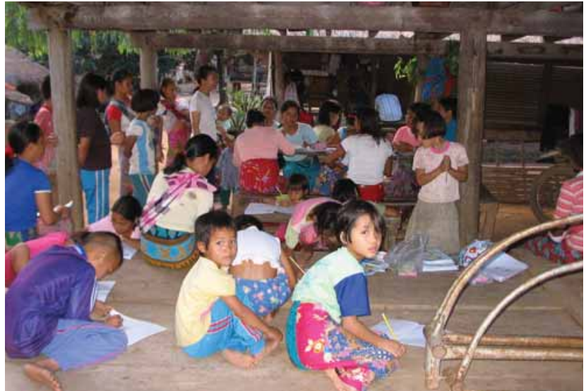
La educación dará poder para siempre a la vida de un niño. Niños asistiendo a FreeSchools en Tailandia.