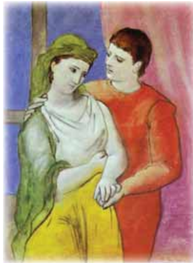
"Los amantes" Pablo Picasso, 1923

E n la vida física, los sentidos se percatan de la existencia de las cosas; la mente descubre la realidad de los significados; pero la experiencia espiritual revela al individuo los verdaderos valores de la vida. Estos altos niveles de vida humana se logran en el amor supremo de Dios y en el amor altruista del hombre. Si amas a tus semejantes, debes haber descubierto sus valores. Jesús amaba tanto a los hombres, porque les adjudicaba un valor tan alto. Puedes mejor descubrir los valores de tus asociados descubriendo sus motivaciones. Si alguien te irrita, te produce sentimientos de resentimiento, debes buscar con simpatía el discernimiento de su punto de vista, sus razones de una conducta tan censurable. Una vez que entiendas a tu prójimo, te volverás tolerante, y esta tolerancia crecerá en amistad y madurará en el amor.