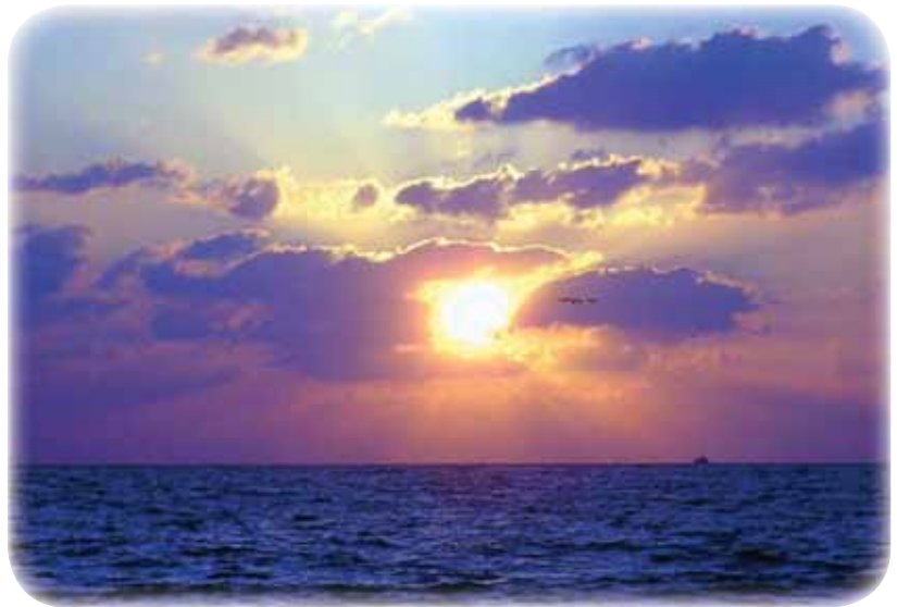
Puesta de sol en Maui

Jefe del Comité de Recaudación de Fondos de la AUI