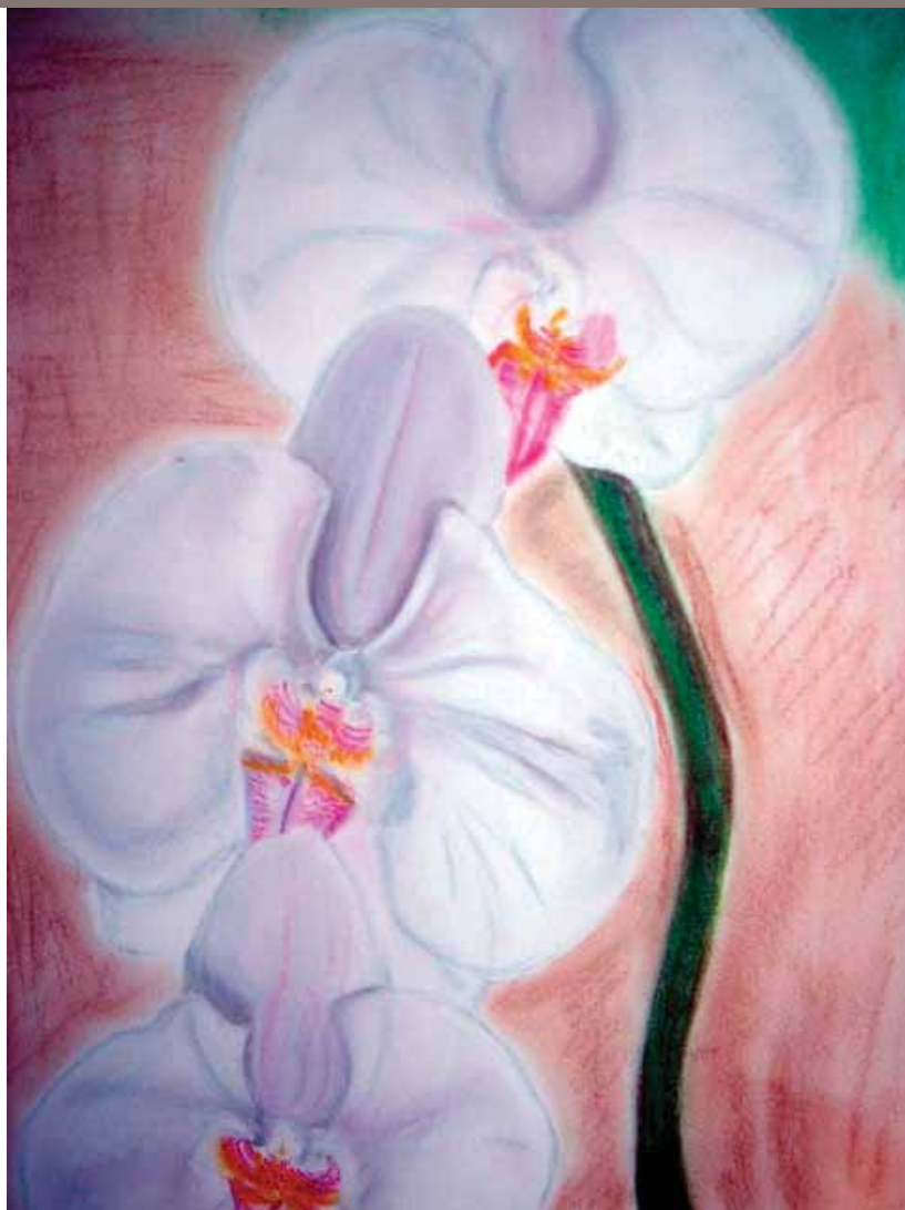
"Orquídeas de Maui" Pintura al pastel de Sheila Schneider