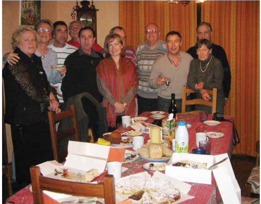
Grupo de estudio de Avignon

DE CHRIS M. RAGELTY Asociación Francófona de Lectores del Libro de Urantia