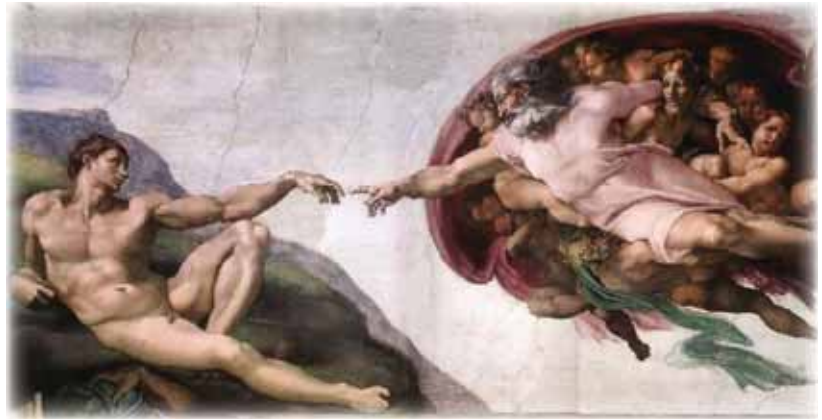
"La creación de Adán" Fresco de Michelangelo Buonarroti, 1510