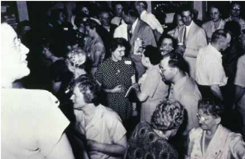
Fiesta del Forum, años 30