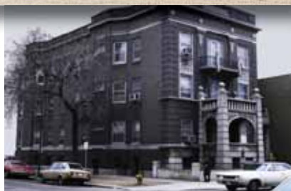
Fundación Urantia, 533 Diversey, Chicago