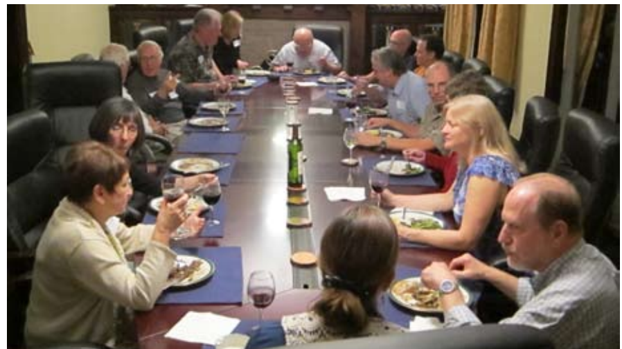
En espíritu de compañerismo, en la Sala del Foro de la Fundación Urantia.

La UBF presentó su proyecto Tubo de Luz, que comenzó en 2002. Sus voluntarios responden a las necesidades de los lectores de El libro de Urantia y de sus traducciones en todo el mundo, especialmente en los países donde el libro no está disponible o el >> coste es prohibitivo. Hasta la fecha, los voluntarios han asegurado que haya donantes para más de 2.800 libros en sesenta y siete países. Aproximadamente el 88% de todos los