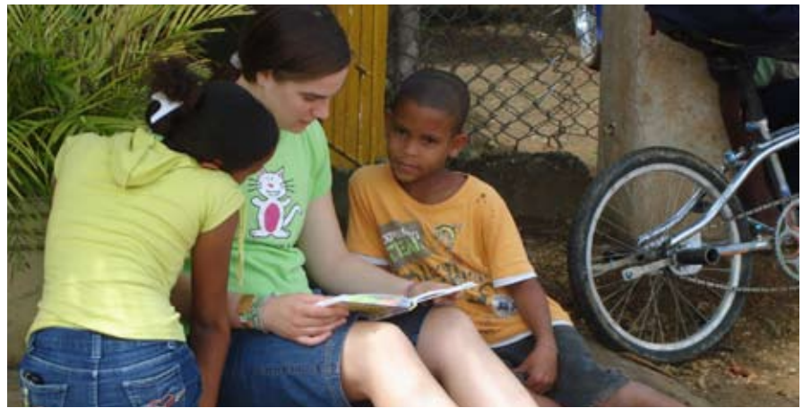
Estudiante universitaria lee a unos niños en República Dominicana.

¡No os engañéis! Existe en las enseñanzas de Jesús una naturaleza eterna que no les permitirá permanecer estériles para siempre en el corazón de los hombres inteligentes. El reino, tal como Jesús lo concebía, ha fracasado en gran parte en la Tierra; por ahora, una iglesia exterior ha tomado su lugar. Pero deberíais comprender que esta iglesia es solamente el estado larvario del frustrado reino espiritual, que esta iglesia lo transportará a través de la presente era material y lo llevará hasta una dispensación más espiritual en la que las enseñanzas del Maestro gozarán de una mayor oportunidad para desarrollarse. La iglesia llamada cristiana se convierte así en el capullo donde duerme actualmente el concepto que Jesús tenía del reino. El reino de la fraternidad divina está todavía vivo, y saldrá sin duda finalmente de su largo letargo, con la