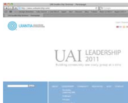
Página web del Liderazgo.

Cada grupo local y nacional de lectores podría tener diferentes respuestas a estas preguntas. Pero una cosa es cierta: en cada