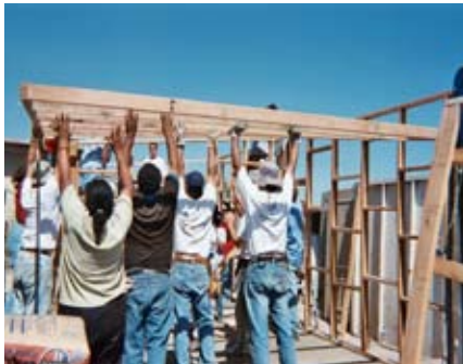
Muchas manos alivian la carga.