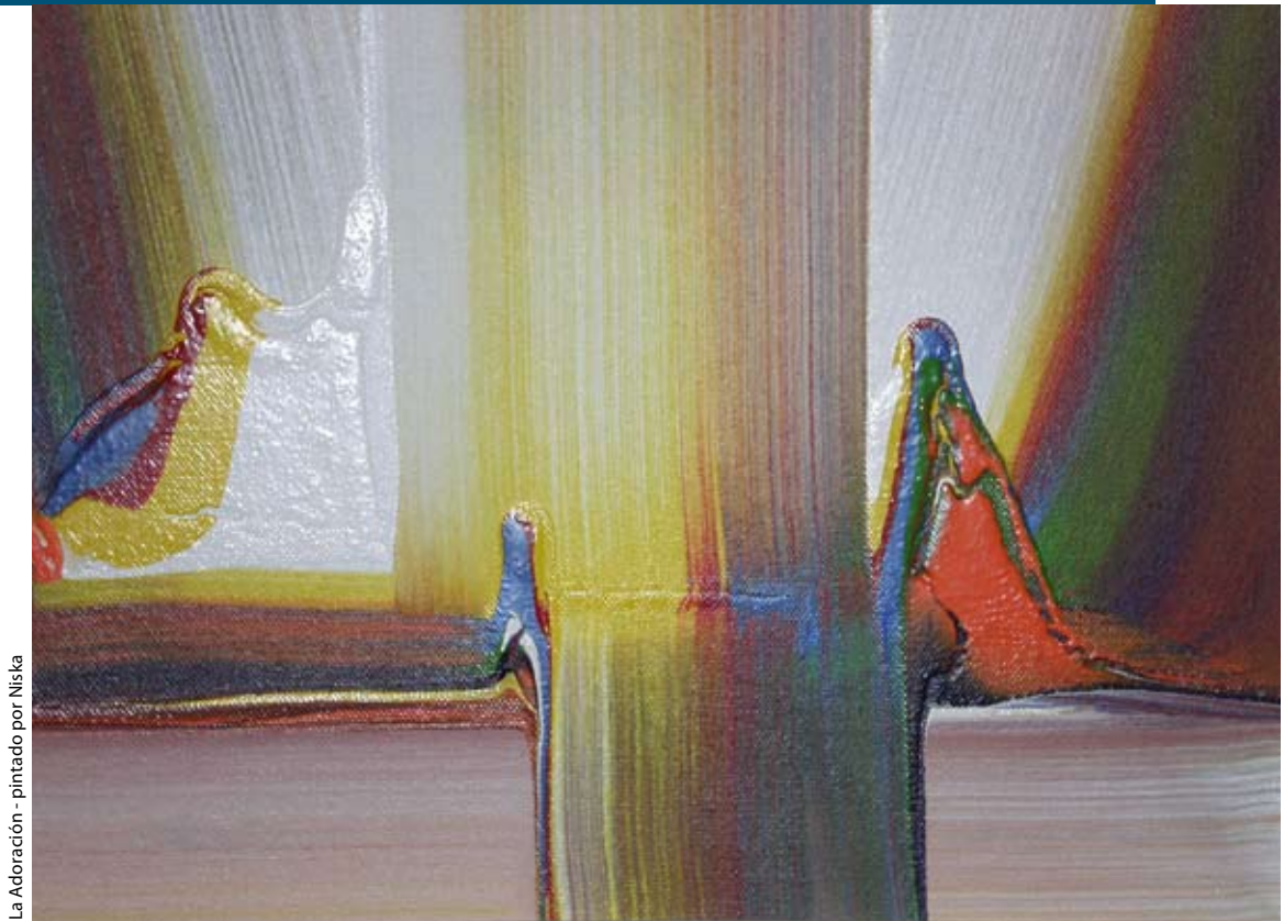
La Adoración - pintado por Niska