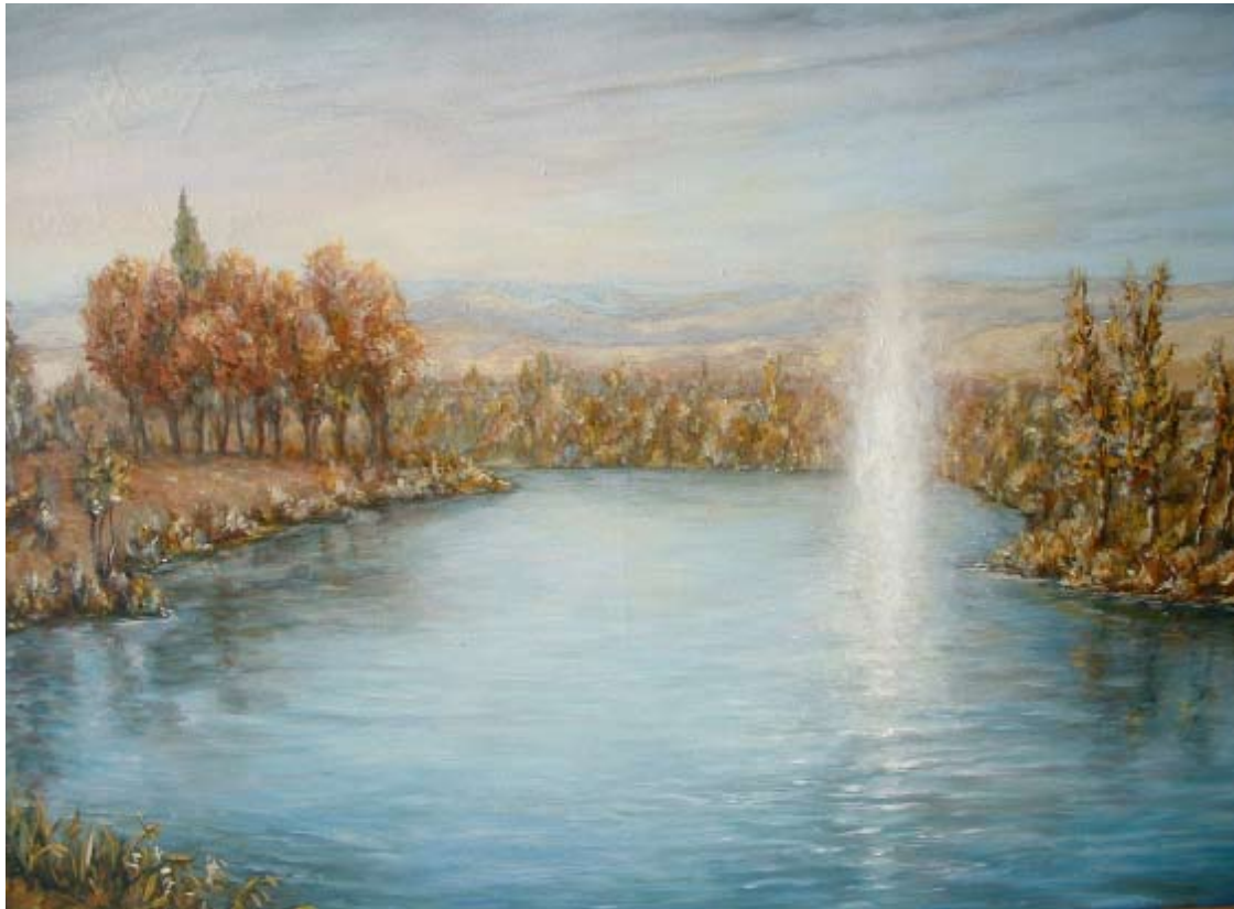
"Acontecimiento en el río Jordán" pintura al óleo de Carlos Rubinsky