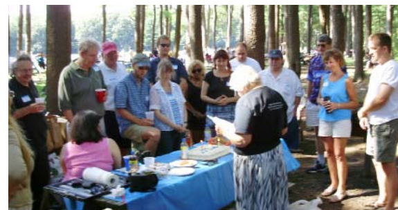
Los lectores de Nueva Inglaterra en el parque Hopkinton de Massachussets.

El encuentro se celebró en el Parque Hopkinton de Massachussets. Este fue un evento social con buena comida y barbacoa, que terminó con un pastel con la instrucción del Maestro: "Amaos los unos a los otros".