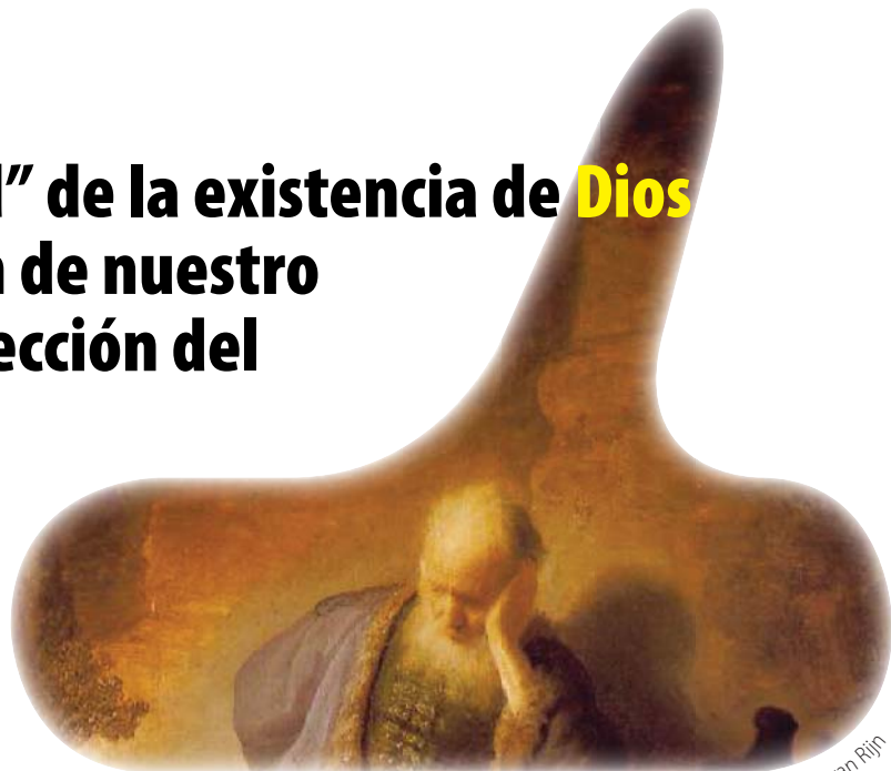
Detalle de una pintura de Rembrandt van Rijn