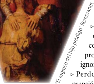
“El regreso del hijo prodigo” Rembrandt