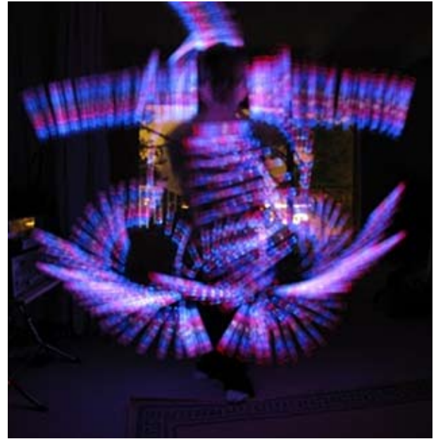
Movido por el espíritu. Imagen.

El desarrollo espiritual depende, en primer lugar, del mantenimiento de una conexión espiritual viviente con las verdaderas fuerzas espirituales y, en segundo lugar, de la producción continua de los frutos espirituales,