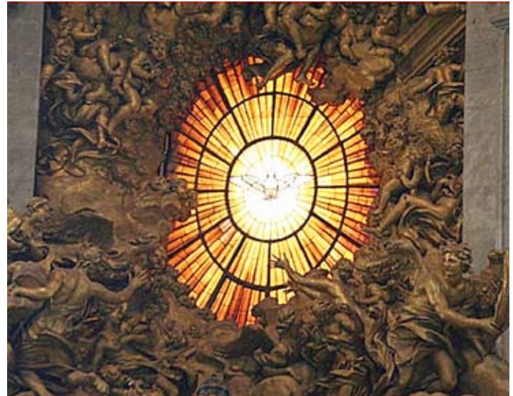
El encuentro de los fieles; detalle de la ventana.

Dios les ha traído aquí esta semana por una razón. Es importante para ustedes estar aquí porque lo que estamos haciendo es importante; creo que esta revelación es el proyecto más importante de este planeta hoy día. Aunque nos importa que nuestros hermanos y hermanas tengan comida suficiente, buena atención médica y una educación adecuada, nos preocupan sus almas eternas. Dios nos ha dado esta oportunidad y esta responsabilidad. Han tomado la decisión de ser líderes de la quinta revelación de época. Ha habido grandes líderes espirituales de Urantia en el pasado. Hay grandes líderes con nosotros