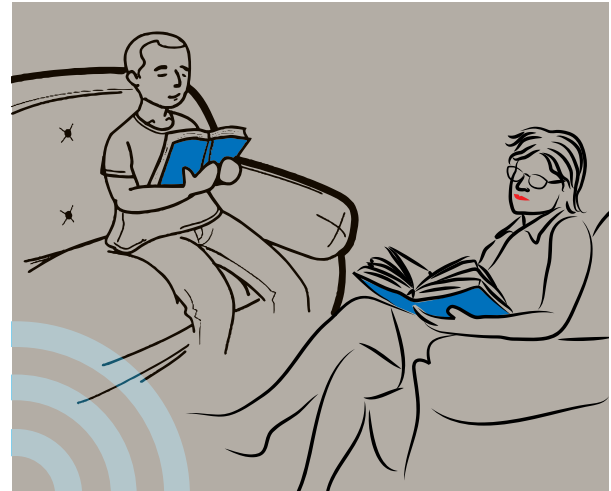
Illustration d'un groupe d'étude

8. Enseigner/expliciter à d'autres membres du groupe aide à maîtriser les informations et les concepts. Enseigner implique la nécessité d'une connaissance étendue d'un sujet.