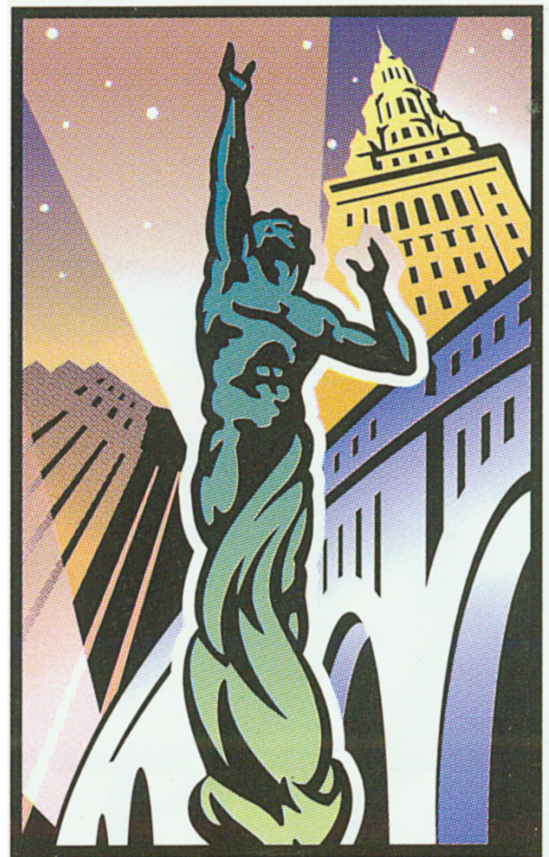
Illustration de répondre à l'appel

Pour commencer à répondre à une question d'une telle importance, je crois que nous devrions d'abord et de manière persistante nous adresser au Dieu intérieur. Sa réponse ne saurait être fautive et nous ne saurions mal faire en suivant sa voie. C'était la technique de Jésus et nous ferions bien de suivre son exemple. Comme Jésus, nous devrions passer un temps significatif à communier avec Dieu, recherchant son conseil dans la prière. Dans la ligne de cette approche, je suggère que nous reformulions notre question sur le service que nous devrions