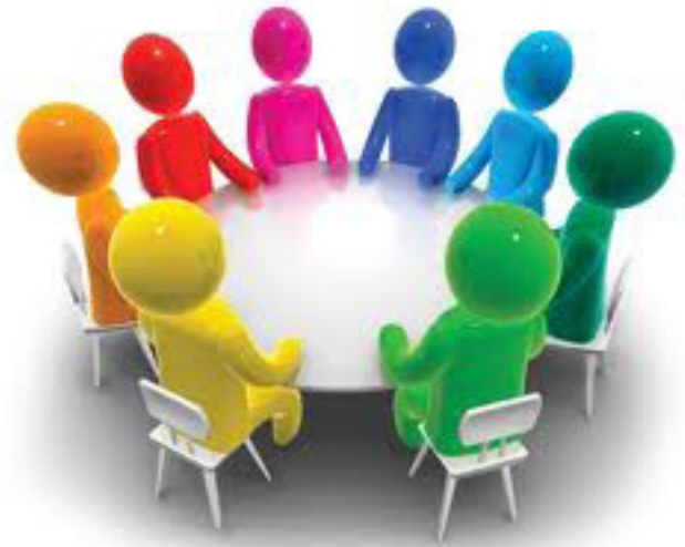
Illustration de la dynamique de groupe

W IKIPEDIA DÉFINIT LA DYNAMIQUE DE groupe comme « ... l'étude de groupe et aussi un terme général pour les processus de groupe. Appartenant aux domaines de la psychologie, de la sociologie et des études sur la communication un groupe c'est deux individus ou plus qui sont reliés l'un à l'autre par des relations sociales ; 1 du fait qu'ils sont en interaction et s'influencent l'un l'autre, les groupes développent un certain nombre de processus dynamiques qui les différencie d'une collection d'individus pris au hasard. Ces processus incluent des normes, des relations, du développement, du besoin d'appartenance, de l'influence sociale et des effets sur le comportement. Le champ de la dynamique de groupe se limite principalement au comportement d'un petit groupe. On peut classer les groupes en agrégats, primaires et secondaires et groupes de catégorie. »