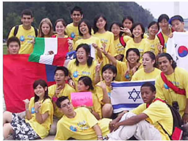
Conférence HOBY, groupe de jeunes dirigeants

Les séminaires de la jeunesse dirigeante de Hugh O'Brian (HOBY) ont une histoire remontant à cinquante-deux ans. Inspirante, éducative, compatissante, énergisante, enthousiaste, motivante, transformatrice, durable et propre à changer la vie.