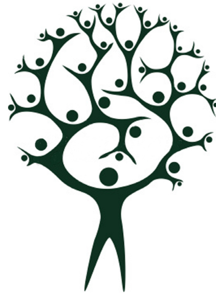
Illustration de l'arbre du travail en équipe

Le défi religieux de l'âge présent est lancé aux hommes et aux femmes spirituellement perspicaces, prévoyants et tournés vers l'avenir, qui oseront construire une nouvelle