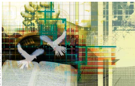
"Livre et Paix" collage

Il est vrai que certaines des activités nécessaires au développement du projet UBtheNEWS sont plus adaptées à ceux d'entre nous qui ont une bonne éducation, du talent